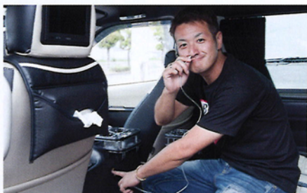
新製品の電圧機能表示がついた汎用タイプのUSBポート。オライもついでに充電～。穴さえ開けて製品入れて純正アクセサリから電源繋げばUSB充電がOK!