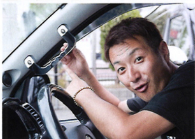
LEってロゴが刻印されたビレットグリップに、跳ね上げたリアシートを保護するポップアップカバー。こんなラグジュアリーなクルマが揃っているからレガンスさんスゴイ

モニターの見えづらさを解消してくれる新型のモニターバイザー! カラバも豊富で、こちらは純正パネル近似色のマットシルバー