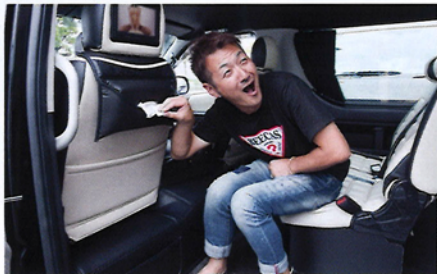
「ティッシュが～」って大切な場面にも安心な、ヘッドレスト装着のティッシュケース。上面は小物が入る収納スペースでカーボン調生地の新タイプも登場