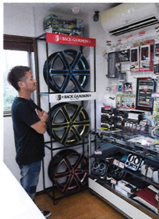
さすが有名ブランド、オリジナルパーツがいっぱいあるやん… BEECASも頑張ってもっとオリジナルパーツ作らんと…