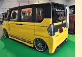
Butterfly System http://www.butterfly-system.com

サイドステップは純正だが、その下に装着するスリムなフラップを開発。リアは従来のセカンドインパクトと比べ、シンプルにデザインしたのがポイント。小振りはリアゲートスポイラーもリリース。