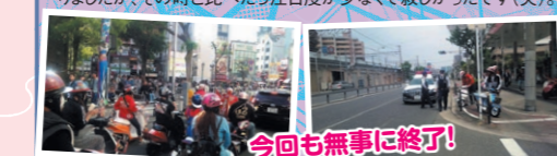
今回も無事に終了!

この日は知る人ぞ知る恒例の原チャリミーティングです。今回はKブレイクに集合して、その後SBMのイベントにピーキスがブースを出していたから見に行き、ご厚意で会場内に入れてもらったので記念撮影。そしていつもの大阪市内一周。前回はクリスマスに走りましたが、その時と比べたら注目度が少なくて寂しかったです(笑)。