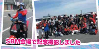
SBM会場で記念撮影しました