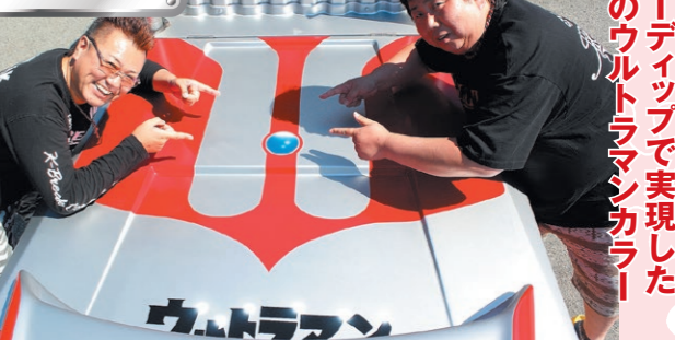
ラバーデッドで実現した 正義のウルトラマシンカラー!