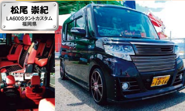
松尾 崇紀 LA600Sタントカスタム 福岡県

フロント&リアバンパーは、バタフライシステムの黒死蝶セカンドインバウト。塗り分けが自慢とのことですが、洗ひ雲気が出ていいですね。デライトも入れることで、さらに今っぽさが増したと思います。ここからさらに手を入れるとすれば、ライトをスモークにしたりメッキを落着きのあるブラックメッキにするのもいいでしょうね。僕もデモカーのタントカスタムに長く乗っていましたが、使い勝手が良くっていいクルマだと思いました!