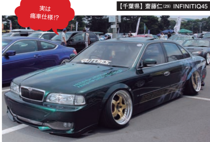
【千葉県】 齋藤仁 (29) INFINITI Q45