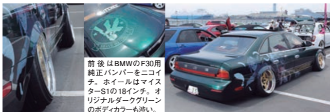
パッと見はシンプルVIP。だけど、よくよく見ると痛車仕様というのが面白いインフィニティQ45。ボディサイドにはキャラクターを流れる感じで入れていて、そこも上手いなぁって思いました。ちなみにオパフェンはF2-R3センチで、ツライチもグッドです。