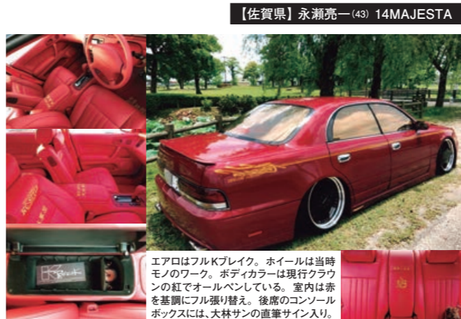
【佐賀県】 永瀬亮一 (43) 14MAJESTA